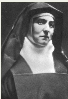
Teresa Benedicta vom Kreuz als Ordensfrau, angefertigt als Passfoto Ende 1938, kurz vor der Flucht nach Holland

Ihr Leben war Zeugnis eines unbeirrt gelebten Glaubens. Als geborene Jüdin und entschiedene Christin überwand Edith Stein Grenzen und wurde als erste Katholikin jüdischer Abstammung von Papst Johannes Paul II. heiliggesprochen. Edith Stein erblickte 1891 als Tochter strenggläubiger jüdischer Eltern in Breslau (Schlesien) das Licht der Welt. Nach der Lektüre christlicher Schriften, vor allem einer Lebensbeschreibung der hl Theresia von Avila, stand für die junge Frau der Entschluss fest: Sie wurde katholisch und ließ sich, inzwischen 31 Jahre alt, taufen. In den folgenden Jahren arbeitete sie als Dozentin und Lehrerin. Trotz der Schuldgefühle gegenüber ihrer alten Mutter trat Edith Stein 1933 in das Kloster der Karmelitinnen in Köln ein und erhielt den Ordensnamen Teresa Benedicta. Als die Juden in Deutschland der Ächtung verfielen, emigrierten die beiden Schwestern in das niederländische Kloster Echt, um die Mitschwester in Köln nicht zu gefährden. Doch auch die Niederlande sollten nicht mehr lange vom nationalsozialistischen Rassenwahn verschont bleiben. Als das "Hirtenwort" des Bischofs